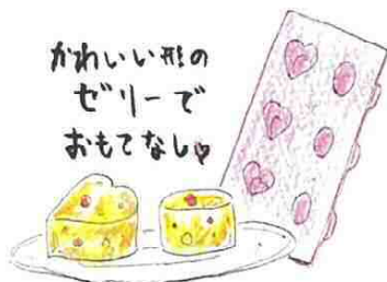
かわいい形のゼリーでおもてなし♪

製氷トレーにミックスベジタブルなどを入れて、味付けしたゼリー液を流し込みます。冷蔵庫で固まらせて、お皿に出すと、可愛い形のゼリー寄せがいっぱい。パーティーの前菜などにピッタリです。