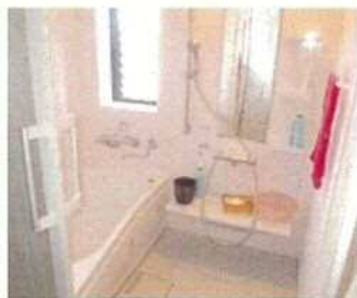
すっきり！ 勝手口の前は 洗い場に。