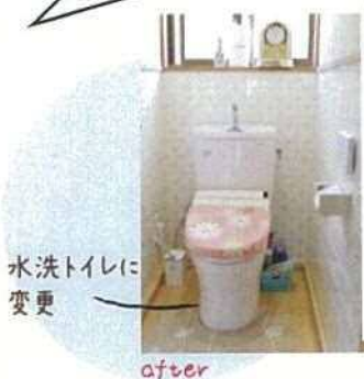
水洗トイレに変更