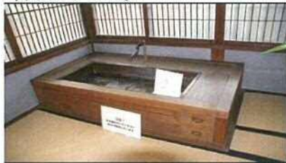
江戸時代のお殿様のお風呂

※当時から薬湯専門の湯屋もあったそうで、柚（ゆず）湯や菖蒲（しょうぶ）湯など利用していたそうです。今で言う「ハーブ風呂」です。