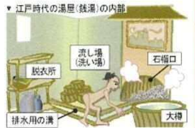
“ナスラック”お風呂の歴史より

当時の銭湯は、蒸し風呂の一種である「戸棚風呂」という形式で、熱く焼いた小石の上に水をかけて湯気を出し、上半身を蒸らし、浴槽に膝の高さ程お湯を入れ、下半身を浸す仕組みです。今でいう“サウナ”方式です。そして、浴室の湯気が逃げないように工夫されたのが「石榴（ざくろ）口」です。これは、三方をはめ板で囲まれた小室に浴槽を置き、出入口に天井から低く板をさげ、湯気が逃げないように防ぎました。客はこの板をくぐり出入りします。