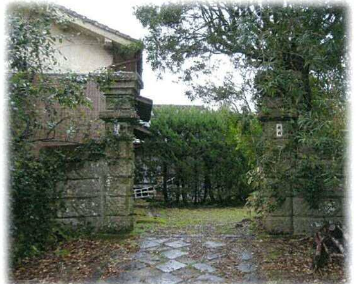
伊佐市大口羽月地内 M様邸

羽月城の城下にある住まいである。現在は居住されていないようである。 切石の門柱、石畳が当時の武家屋敷を彷彿とさせる。蔵は離れではなく母屋と繋がっている。 中々珍しい作りである。